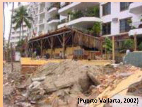
(Puerto Vallarta, 2002)

Estimular el intercambio de experiencias entre científicos en ciencias atmosféricas y sociales y tomadores de decisión en las distintas esferas de gobierno, sobre la problemática de entrada a tierra de ciclones tropicales.